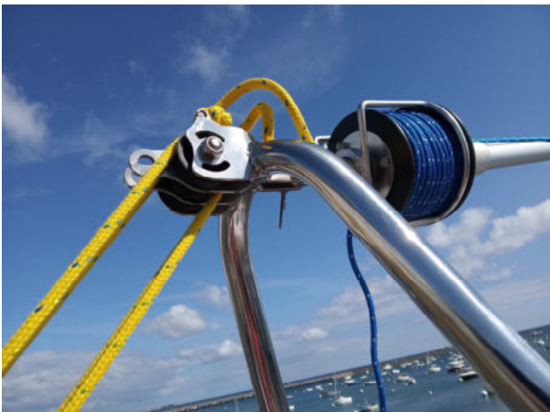
<- Système de relevage de mat en V