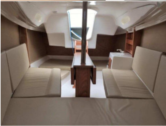
<- Modèle sans cabinet de toilettes